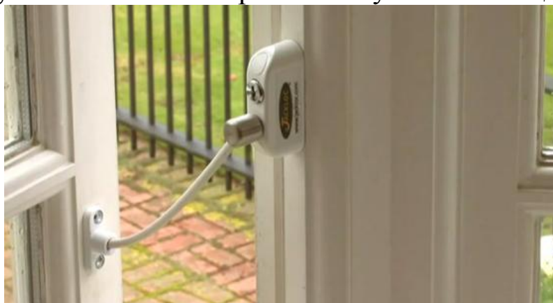
Вариант замка на пластиковое окно

Ставим замки. Некоторые мамы снимают ручки с окон в детских, но это исключает возможность проветривания. Так могут поступать мамы самых резвых и хулиганистых деток!