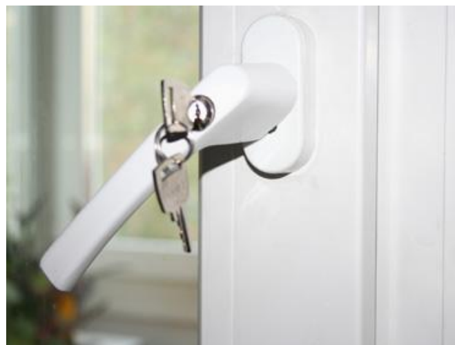
Замок на ручку окна