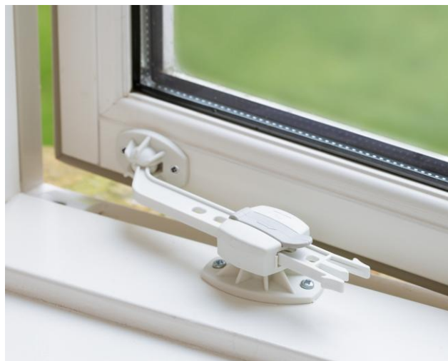
Защита на пластиковые окна от детей

Проблема очень болезненная, ведь страдают дети! Какой из вариантов подойдет вам, спрашивайте у производителей окон. Главное, чтобы родители задумались о безопасности своего ребенка.